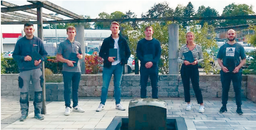
Die neuen Auszubildenden starten ausgestattet mit einem iPad die Ausbildung im Hause Nilsson.

2021 begrüßen wir wieder acht neue Auszubildende in unserem Baufachzentrum